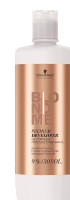
POUDRE BLONDME CLAY 1+2 RÉVÉLATEUR BLONDME 9% Schwarzkopf professional®