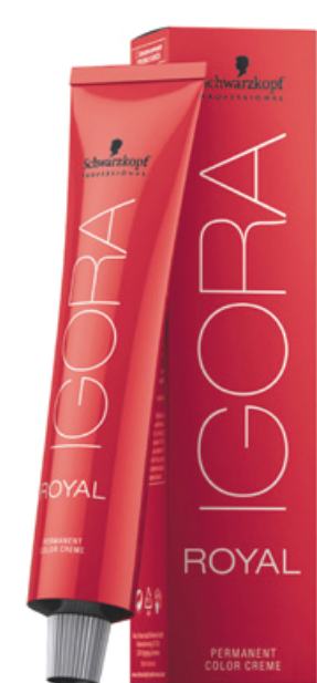
IGORA ROYAL 6,46 Schwarzkopf professional®