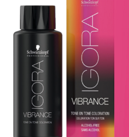
IGORA VIBRANCE 9-49 Schwarzkopf professional®