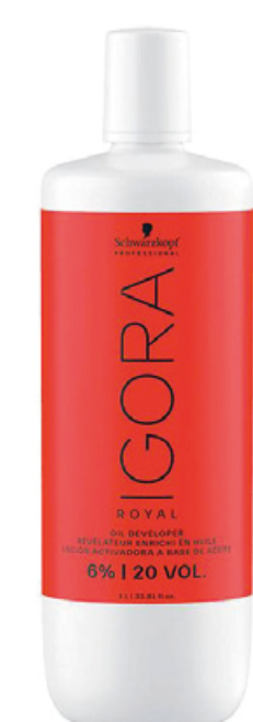
RÉVÉLATEUR IGORA 6% Schwarzkopf professional®