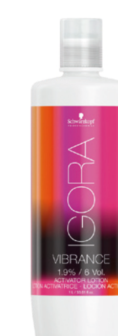
GEL ACTIVATEUR 1.9% Schwarzkopf professional®